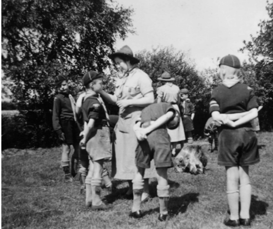
1956: Ans als akela bij de welpen van de Aymondshorde, Petrus en Paulusgroep, Amsterdam