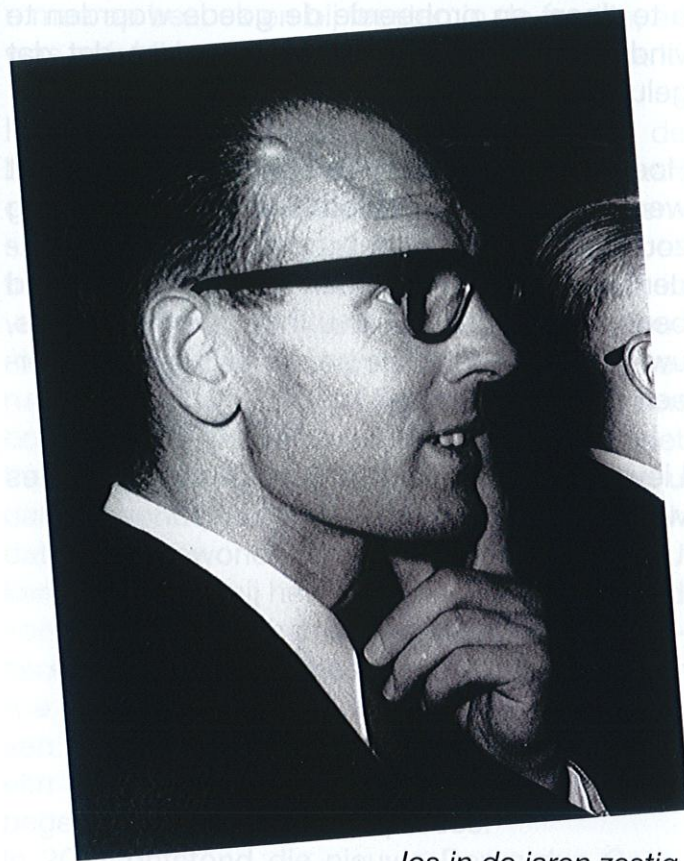
Jos in de jaren zestig